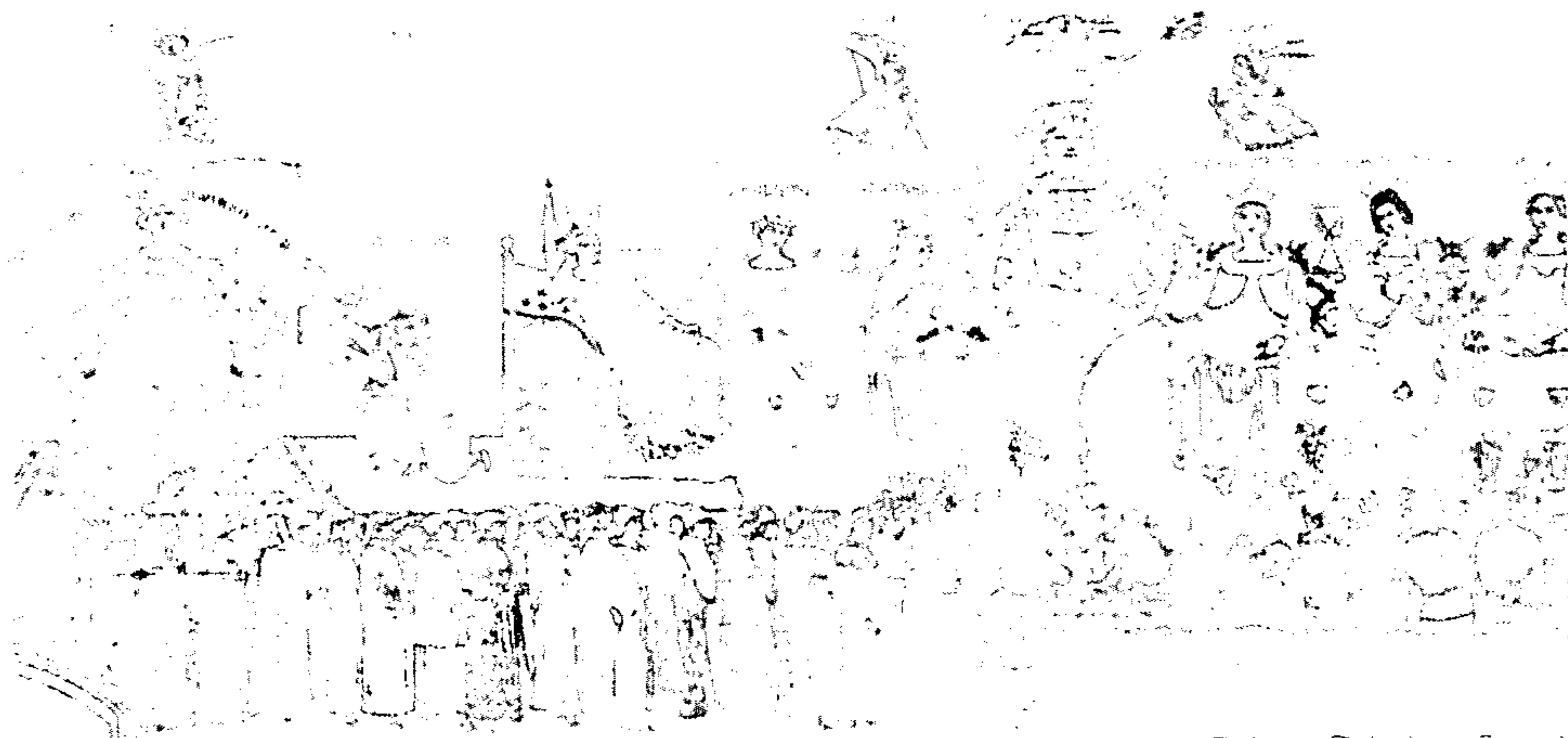
Allegoria del Buongoverno - Ambrogio Lorenzetti (1338-1339). Sala della Pace. Palazzo Pubblico Siena

“Interventi mirati al contrasto della corruzione nella Pubblica Amministrazione Centrale e Locale”